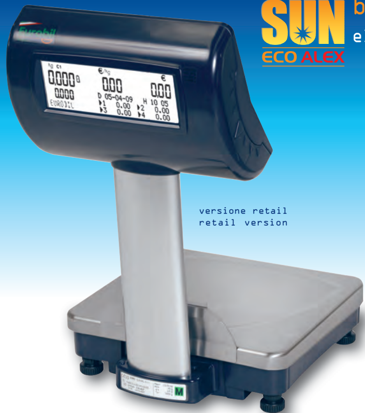
versione retail retail version